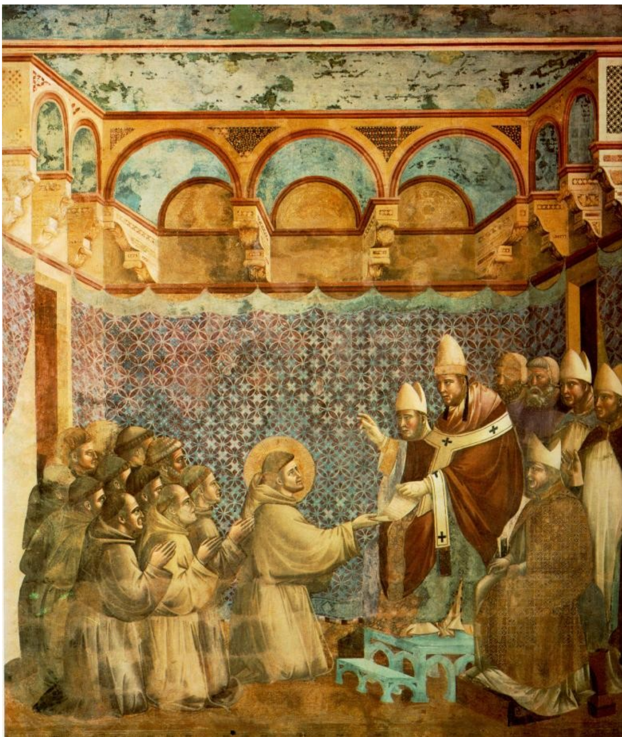
Святой Франциск перед Папой. Утверждение Устава.