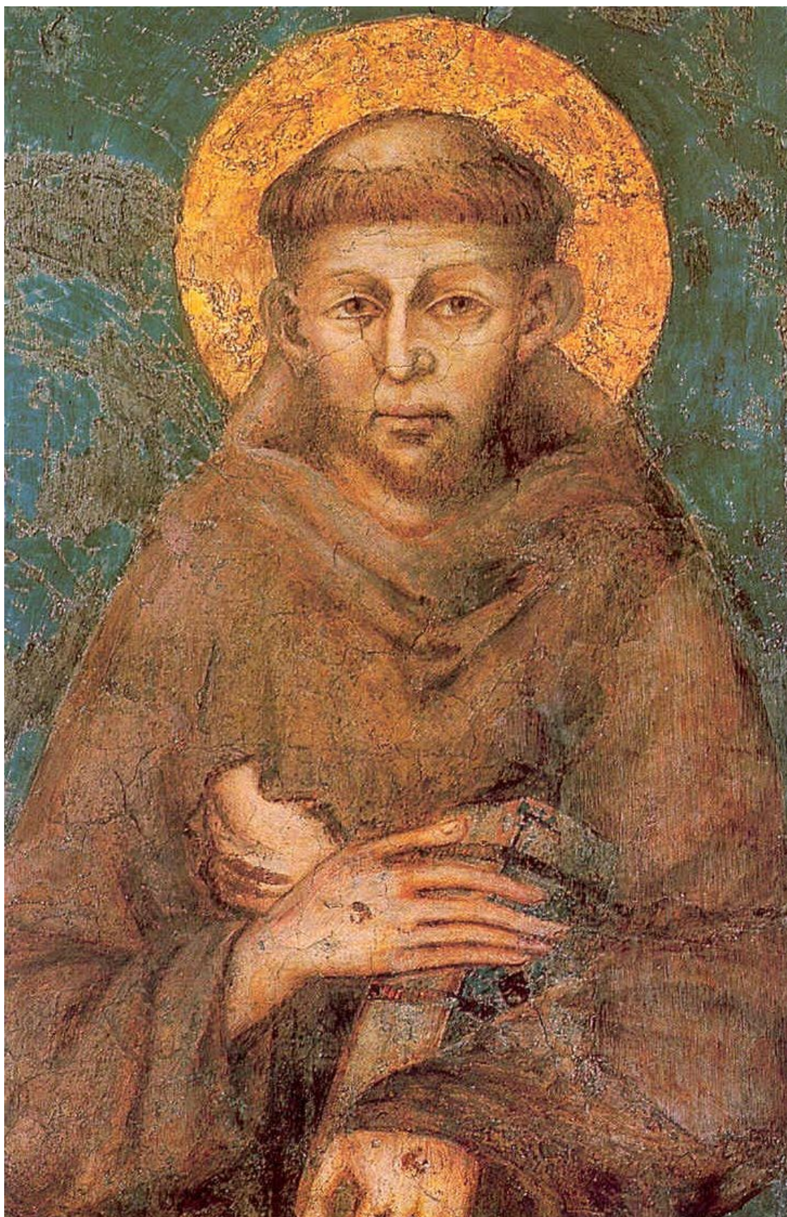
Святой Франциск Ассизский