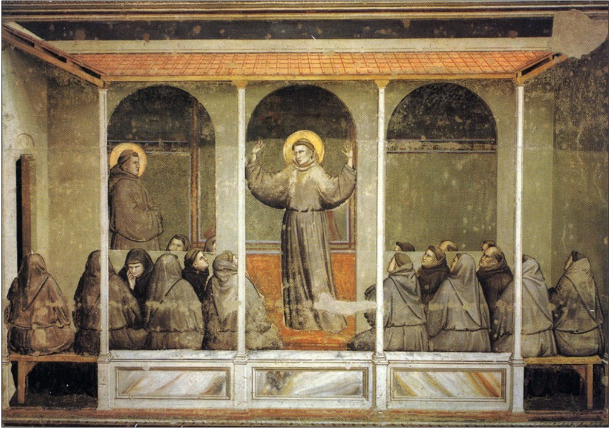
Святой Франциск с братьями-миноритами.