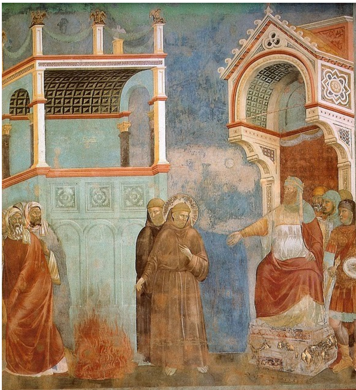
Святой Франциск проповедует Султану.