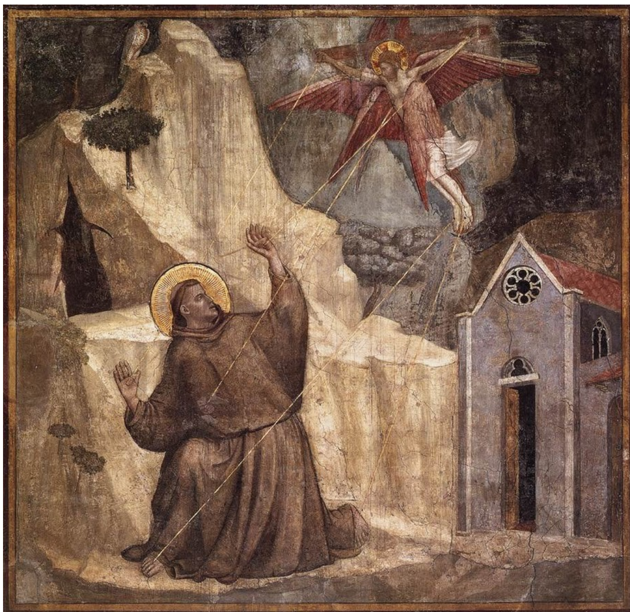
Святой Франциск получает Стигматы