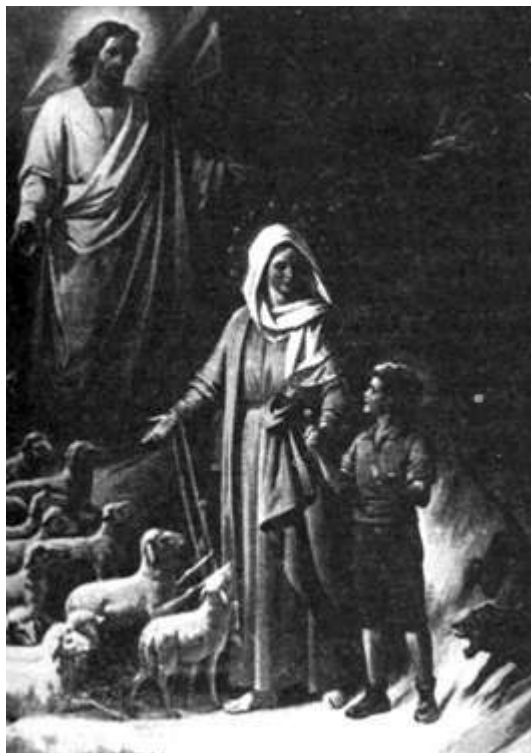
Картина, изображающая пророческий сон 9-летнего Джованино Боско

В девятилетнем возрасте мне приснился сон, который глубоко запал в моей памяти на всю жизнь.