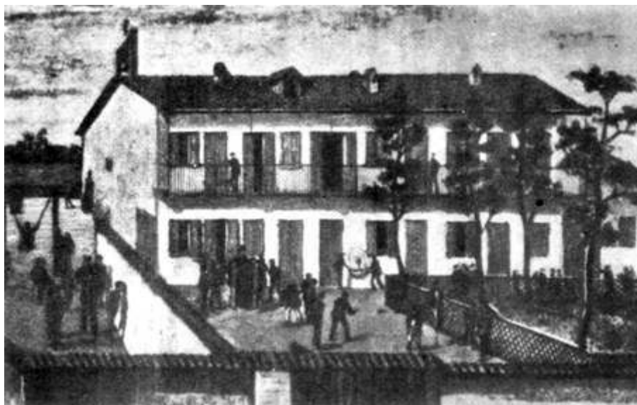
Дом Пинарди, после реставрации

ла им грудь. Радость от того, что, наконец, имеют помещение исключительно для себя.