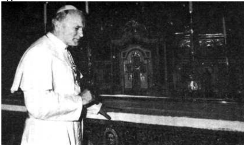
Иоанн-Павел II перед алтарем, за которым находятся почитаемые останки Святого Джованни Боско